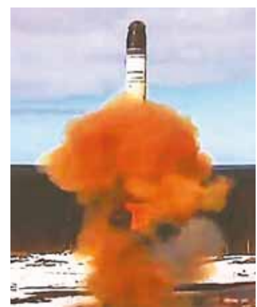
Запуск ракеты «Сармат» с космодрома Плесецк в Архангельской обл.

Эта ракета очень нужна стране. Есть серьёзные основания полагать, что «украинские товарищи» слили американским партнёрам всю документацию по комплексу «Воевода». «Сармат» обладает очень мощной энергетикой и способен угрожать Союзным Штатам с разных ракурсов. Например, лететь не через Северный, а через Южный полюс, откуда его никто не ждёт. К тому же размещение новых ракет в Восточной Сибири, под Красноярском, в 62-й ракетной Ужурской дивизии, делает невозможным перехват «Сарматов» на активном участке траектории, когда ракета только разгоняется».